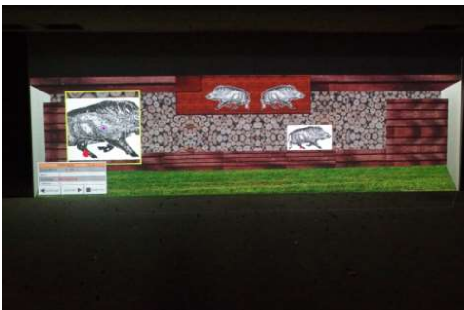
Exemple d'écran sur cible mobile : il est possible de revoir les points d'impact de chaque tir.

Pour cette épreuve, bien évidemment, un seul tireur peut s'exercer. La zone dans laquelle le tir a été réalisé se colore de manière temporaire sur une autre cible modèle. Un rapport avec les 5 tirs peut être édité et imprimé. Il est également possible de revoir le point d'impact avec un grossissement.