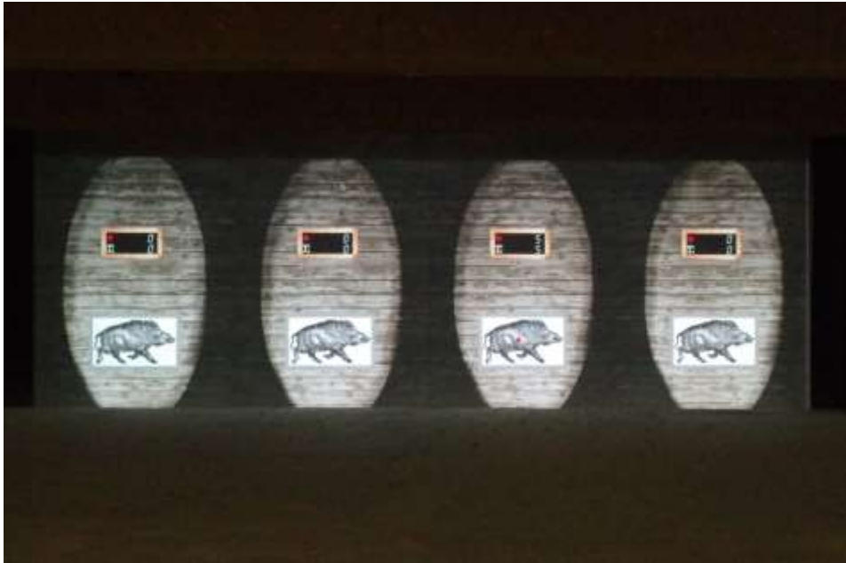
Exemple d'écran pour la cible fixe : 4 tireurs peuvent s'exercer simultanément.

Quatre cibles apparaissent sur les écrans et peuvent être utilisées de manière indépendante. Cela permet donc à 4 tireurs de s'exercer de manière simultanée. L'écran de contrôle permet de voir le résultat du dernier tir et la somme des points obtenus pour les 5 tirs. La zone dans laquelle le tir a été réalisé puis le point d'impact se colorent de manière temporaire. Un rapport avec les 5 tirs peut être édité et imprimé pour chaque tireur.