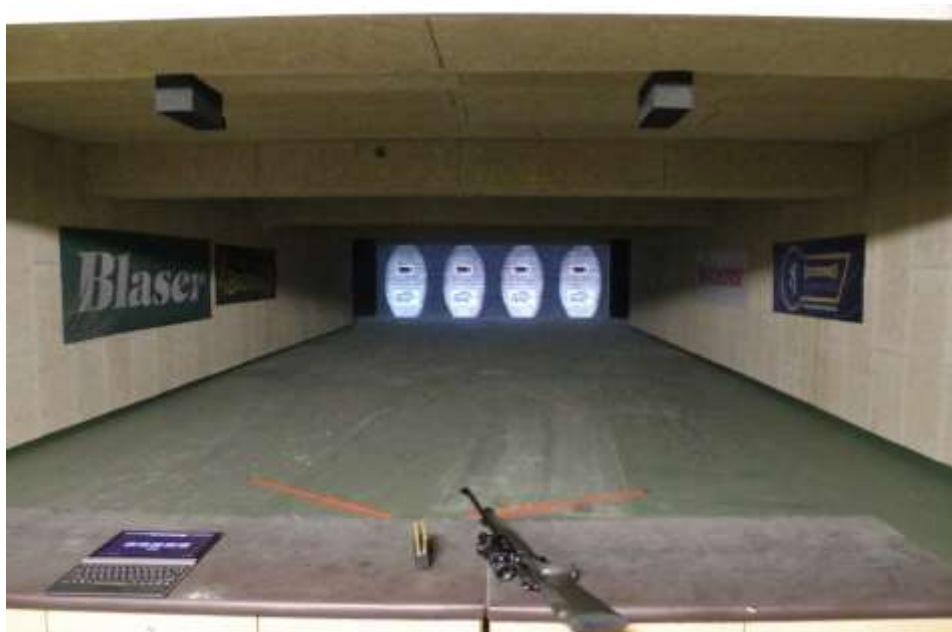
Position de la zone de tir et de l'écran. La taille de la cible varie pour simuler les distances de 30 m pour la cible fixe et 25 m pour la cible mobile.

A première vue, tout est similaire aux séances sur stand de tir à ciel ouvert. Nous retrouvons la cible sanglier déposée par l'ANCCG. Un écran pour le tir sur cible fixe et un écran pour le tir sur cible mobile sont présents. Un avantage majeur est que la numérisation inclut la correction de la taille du sanglier selon l'épreuve (rappelons que le tir sur cible fixe se réalise à 30 m et que le tir sur cible mobile se réalise à 25 m). Cela permet au candidat de rester au même endroit et de limiter tout déplacement et matérialisation de la position du candidat durant les deux parties de l'épreuve. Les armes restent posées sur le meuble quand elles ne sont pas utilisées.