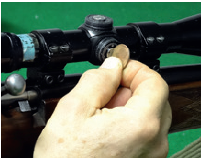
Sur cette lunette américaine, un clic déplace le réticule de 1/4 de pouce à 100 yards (6,35 mm à 90 m)

En matière d'optique, la qualité se paie. Les lunettes de bonne qualité sont chères, celles d'excellente qualité sont très chères et dans ce cas, leur prix est souvent plus élevé que la carabine qui les porte