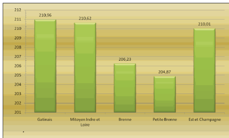
L'indice de conditions physiques, appliqué à l'échelle de 5 unités cynégétiques, montre des disparités importantes en mm.

Après seulement quatre années d'application, le nouvel outil de gestion quantitative a autorisé la mise en place d'un programme efficace de gestion prédictive des populations impliquant notamment le contrôle de toutes les réalisations. Il est fondé sur des paramètres biologiques représentatifs de la structure de la population et se focalise sur l'évolution du ratio des bichettes comme indicateur de dynamique de population. Il est de plus assorti d'un suivi d'indice de conditions physiques. La simplicité du protocole a permis l'implication efficace de presque tous les acteurs cynégétiques concernés qui ont fourni les mandibules, les formulaires de déclaration et rendu les bracelets inutilisés dans les délais requis puisque 95 % des données étaient disponibles quelques jours seulement après la fermeture de la saison de chasse. Ce développement de la méthode à l'échelle